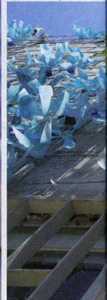
פרח על הרשת