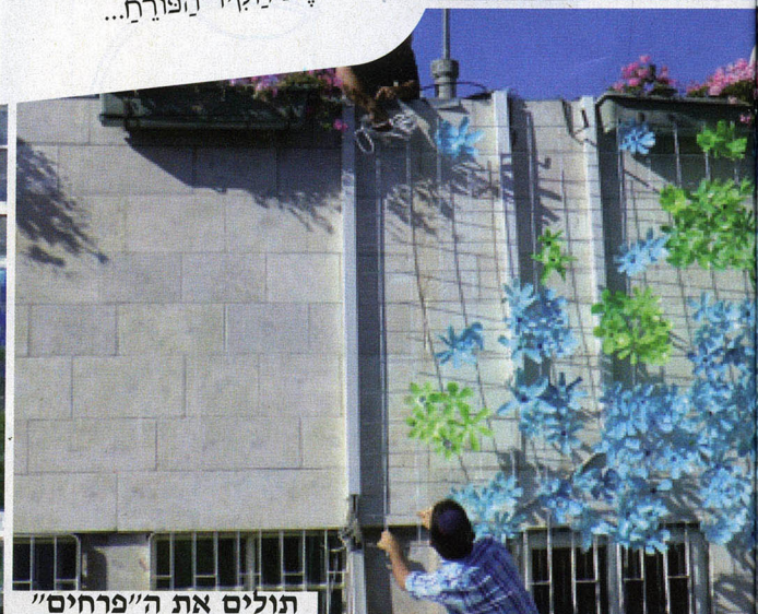
תולים את ה"פרחים"