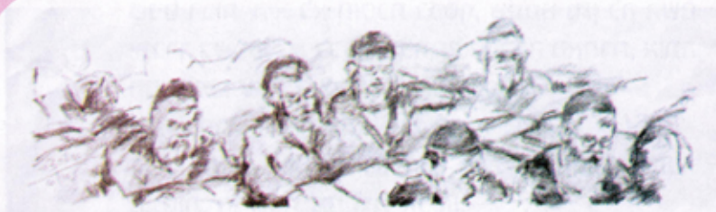
ציור פחם של איילה צור

פרט וכלל, שאין זה יכול בלא זה, שזה משלים את זה, וכולם נותנים כתף למטרה אחת משותפת. ועם המיצגים מגיעות התובנות, התהיות, התמיהות השאלות וההארות, שהרי מהו חלקו של היחיד בתוך הציבור? האם הוא משועבד אליו, או ניזון ממנו? האם הציבור הוא אוסף של פרטים או משהו חזק פי כמה?