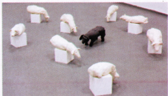
הכבשים - מאת הדר משען, מיצג אמנותי

רשמי ביקור בתערוכת בית הספר "אמן" בירושלים