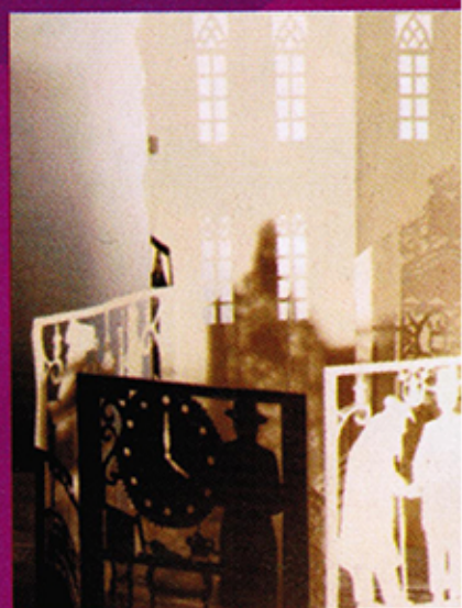
מנזרות נייר - מאת יעל דיקמן