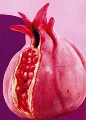
קרמיקה - מאת מרב מרשה