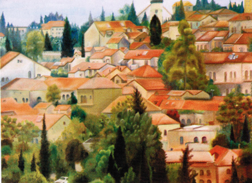
אמנות - מאת נטלי