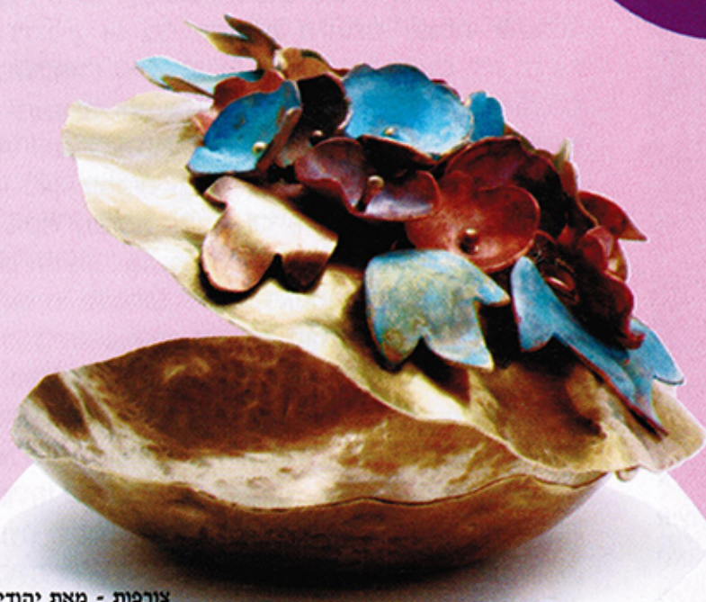
צורפות - מאת יהודית קורן