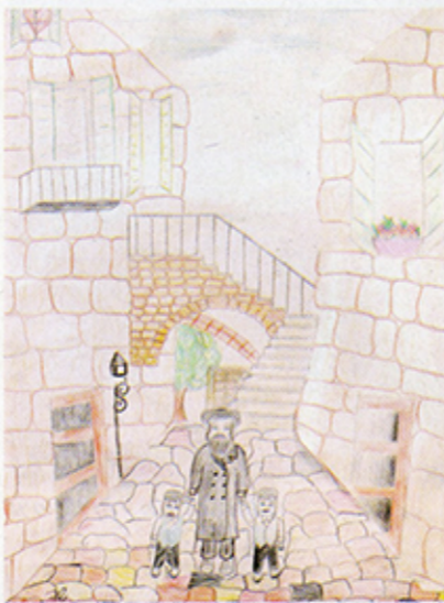
ספי - רחוב מירלס

"כמוכן שהתעלמו מהשמות, התחננו לגיל. ציור מדעים של "ציר" בכתה ב', הוא ציור הגיל אצל ילד בכתה ו'. מתוך הרקע האמנותי שלנו, וכלנו להבחין אם הילד ציר את הציור בעצמו, או נעזר במבנה איך? על פי הסוים הגרפיים, על פי מרקם הצבעים, הצביעה, היכלת להפך תלת מימד לדו מימד ועוד ועוד. וכלנו גם לדעת אם הציור הוא העתק של גלויה, תמונה מספר, או משהו מקורי של הילד. צפינו שהילדים יתבוננו, יקלטו בחושים, יבחרו את הדברים המרגשים, וזה יבוא לידי בטוי בציורים. הפרס נתן עבור יצירה ולא העתקה. כשהיה ברור לנו שזהו הציור של הילד, בחנו מקוריות, יצירתיות וכשורים. לבסוף, העלינו את מספר הזוכים לחמשה, והם זכו בתלושי קניה, שאותם יכלו לממש בחנות ספרים או צעצועים. היה אכפת לנו מכלם, ולא רצינו שאף אחד יתאכזב. לכן חלקנו לכלם שקית עם ממתקים, וגם העברנו את הציור