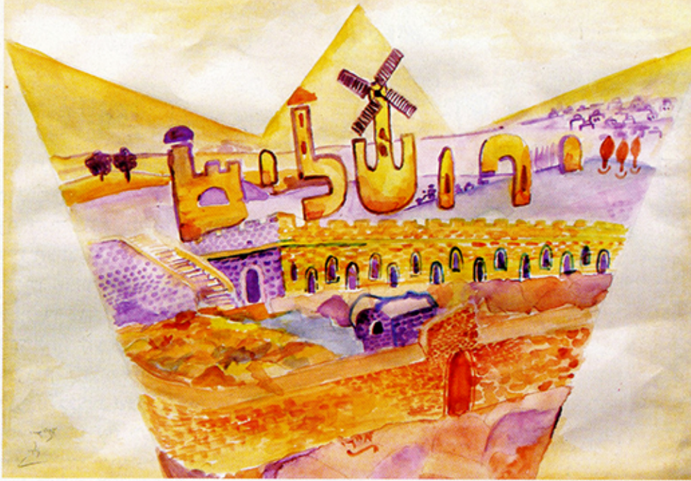
איריאוי - כתר ירושלים