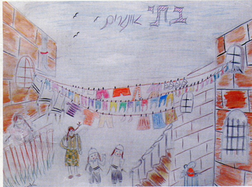
סתי מירלס - סתי אונג'רין

זה קרה לפני כשנה. באוירה חגיגית התפנסו מאה ילדי חמד באולם הארועים של מתנ"ס רוממה, כשהם מלוים בהורים, באחים ובאחיות, בסבים ובסבתות ובמבקרים נוספים. על כתלי האולם היו תלויים ציורים רבים, והנאספים עברו מאחד לשני והתבוננו בהם. "את זה אני צירתי!" "ואת זה אני צירתי!" "הנה הציור שלי!" נשמעו קריאות הצהלה מסביב.