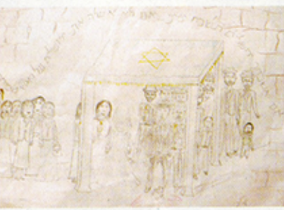
חומי סיני - חולסה ירושלים