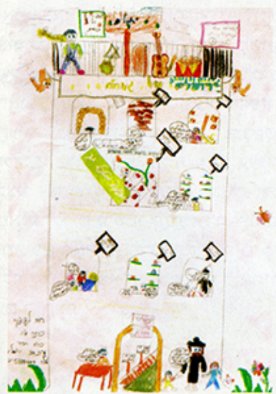
חומי ארנון - זמרים

שבירת הפוס. השמחה נכרת על הפנים, והלבוש החגיגי מספר לנו כי אנו נמצאים בחתונה יהודית, בדיוק בזמן שבו מעלים את זכרון ירושלים: "אם אשכחך ירושלים תשכח ימינו... אם לא אעלה את ירושלים על ראש שמחתי".