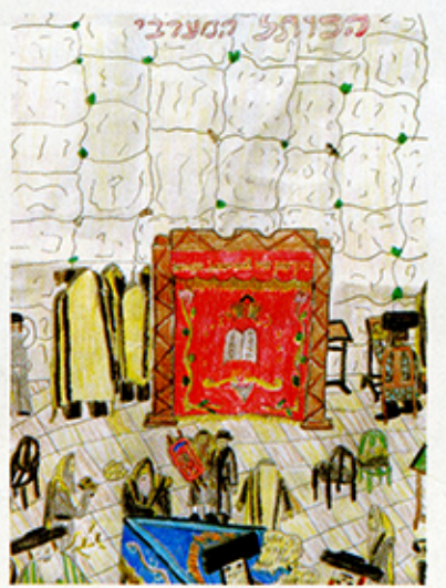
צחק יצחק קליין - ספר תורה סכנת