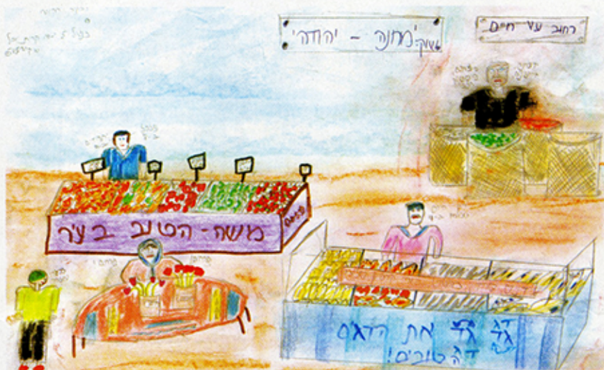
רחקה רחוקה - פלח חנה יהודה