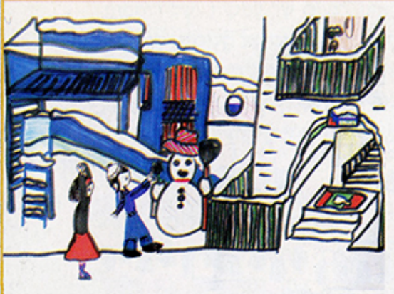
חיה Kapel מריל - ג'ונת מילרס