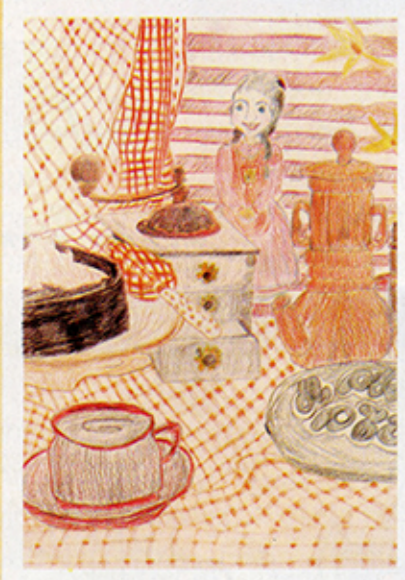
ג'טי טאלר - טמח מירלס le פס

של כל אחד ואחד לפורמט קטן. זה, הצמד למגנט, כך שאפשר לראות את הציור על גבי דלת המקרר."