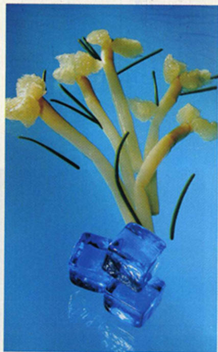
אספרגוס בכחול.

כשאור נופל בצורה כזו או אחרת, הוא גורם לנו